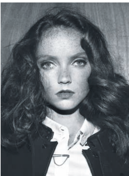
Het Britse model en actrice Lily Cole voor G-Star.